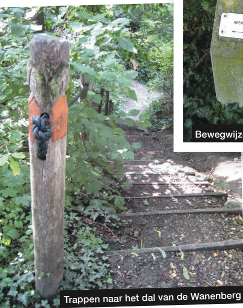
Trappen naar het dal van de Wanenberg

haar beschikking. De heemtuin werd in verschillende fasen en geheel 'met de hand' door vrijwilligers aangelegd. In het hart van de tuin liggen twee betonnen vijvers. De vijvers zijn gescheiden door een bruggetje, zodat de planten en dieren in beide vijvers gemakkelijk van nabij bekeken kunnen worden.