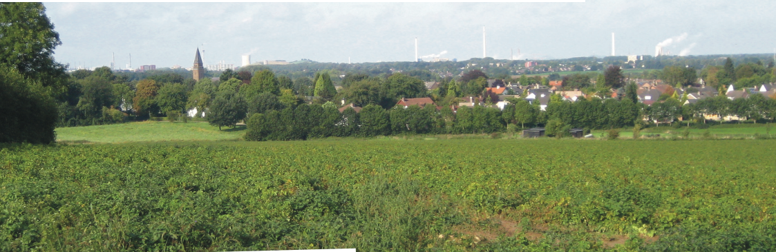
Uitzicht over Munstergeleen