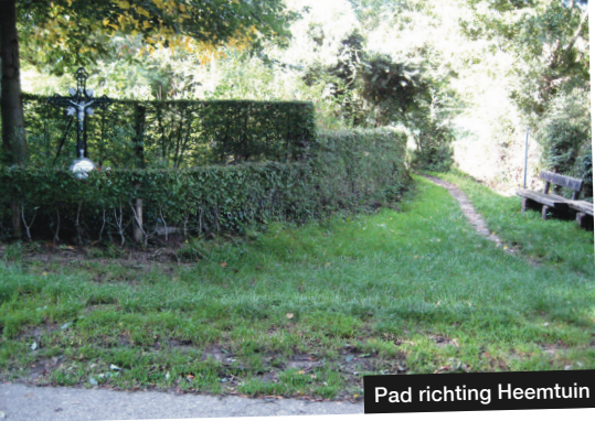
Pad richting Heemtuin

het dal. De heuvel vormt een deel van de westelijke rand van het Plateau van Doenrade langs het Geleenbeekdal.