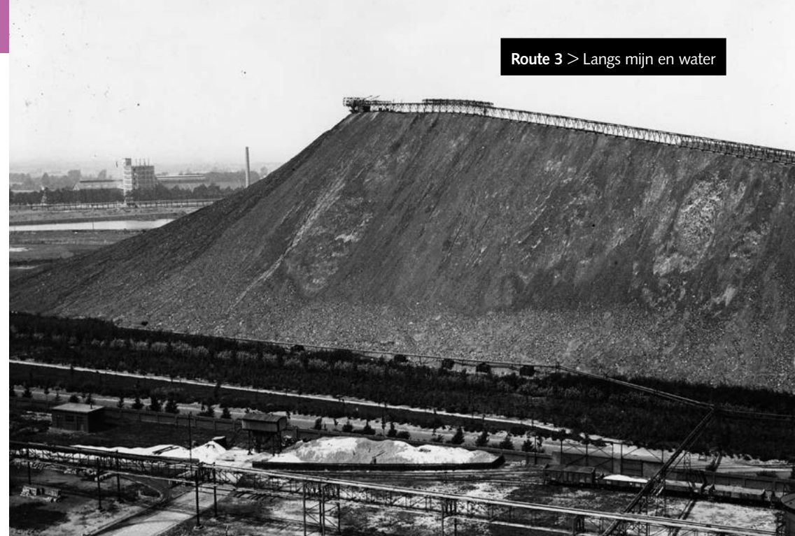
De steenberg van de Maurits

Na de loonhal eerste Ra (Ringovenstraat). Rd naar Heidestraat. In de Heidestraat is links nog een oude houten noodkerk te zien. Tweede straat La (Valderenstraat). Op de hoek ziet u een toren van de Engelbewaarderskerk. De kerk was gebouwd in de jaren '50 en slechts veertig jaar later weer afgebroken. Derde straat Ra (Geraniumstraat). Hier staat een beeld van 'Koempel Sjeng', midden in de wijk Lindenheuvel.