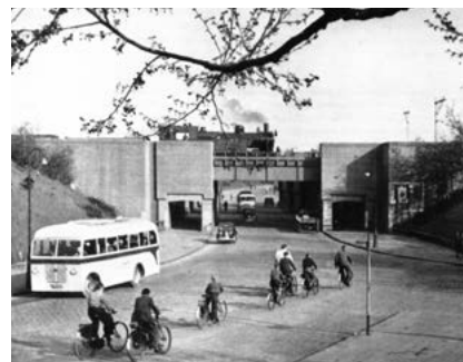
Julianatunnel kort na de opening