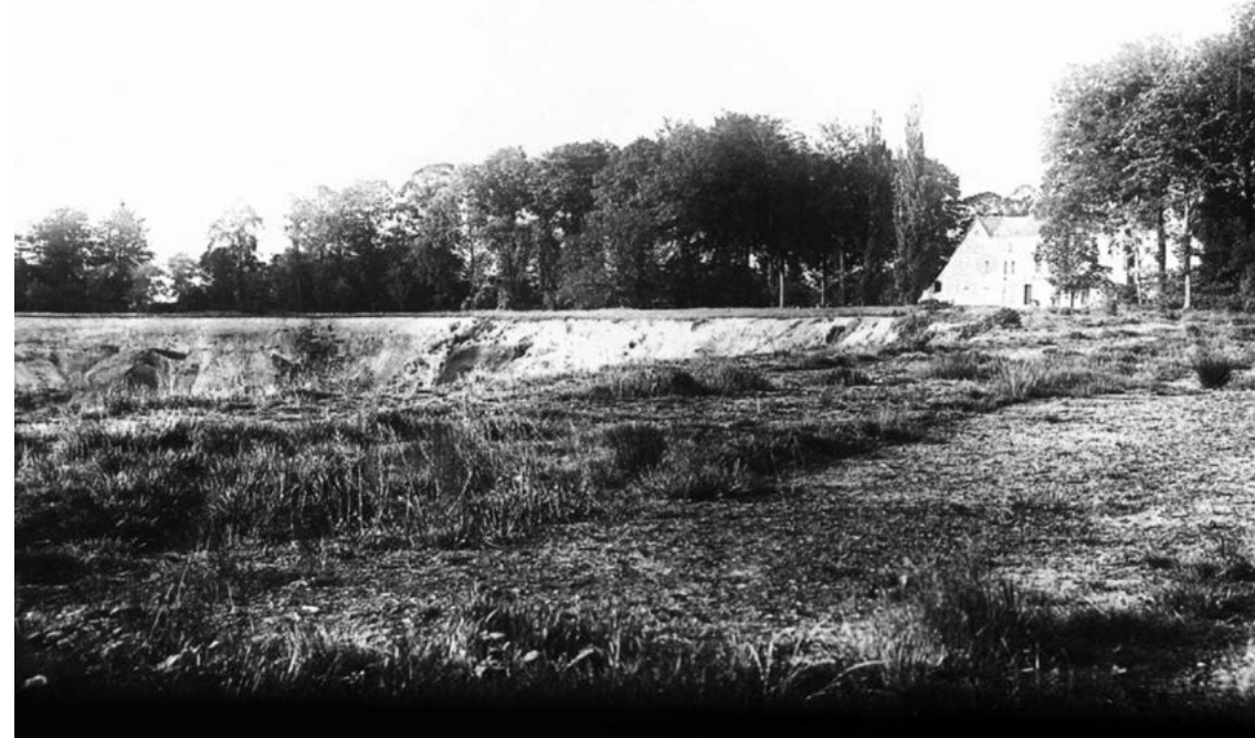
Bruinkoolgroeve op de Graetheide

Van 29 naar 27 langs de oude Bergerweg. In Berg voor de brug La richting 41 via Urmond naar Stein.