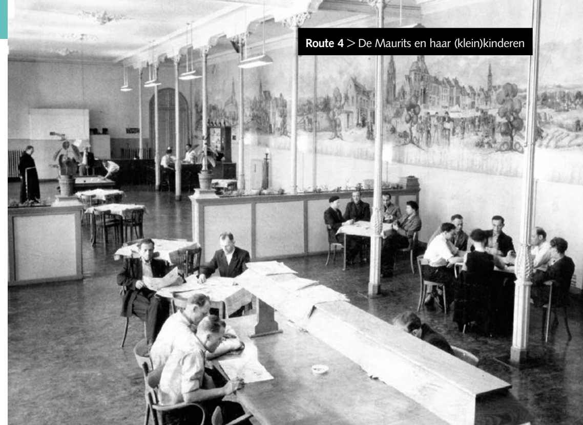
Gezellenhuis in het Sittardse Kloosterkwartier

In het Kloosterkwartier 2 woonden Ursulinen, Dominicanen, Jezuïeten en Franciscanen. De gebouwen hebben onder andere dienst gedaan als stadhuis, klooster, gendarmerie, gevangenis, openbare school en hogeschool. Van 1945 tot 1963 was hier ook een 'gezellenhuis', een huis voor (veelal buitenlandse) vrijgezelle mijnwerkers van de Staatsmijn Maurits. De weg volgend ziet u voor u Museum De Domijnen 3 (dagelijks open van 11-17uur m.u.v. maandag). In dit museum vindt u verrassende tentoonstellingen over de historie van stad en streek en met