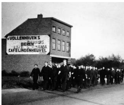
Tewerkgestelden uit kamp Graetheide op weg naar de mijn

Hier ziet u een aantal Oostenrijkse woningen. Na ongeveer 150 meter ziet u links van u het beeld van Koempel Sjeng 10 , die symbool staat voor de mijnwerkers die in de Maurits en andere mijnen hebben gewerkt.