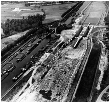
Transformatie in beeld, de oude en nieuwe sluis

Bij 29 La richting 38 , maar na oversteken grote weg (Urmonderbaan), afwijkend van knooppuntenroute Rd blijven rijden. Links van u nu een park, maar vroeger het 'kamp Graetheide'.