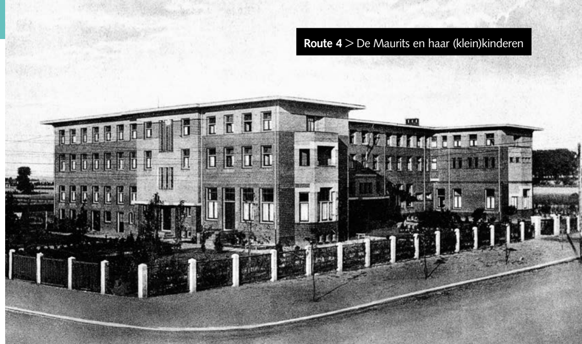
Het voormalige gezellenhuis in de Burgemeester Lemmensstraat