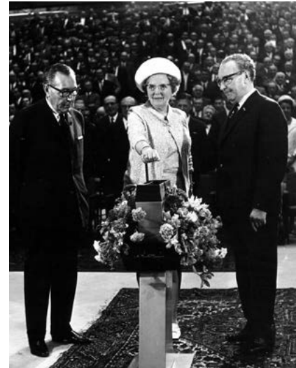
Opening van de DAF-fabriek door koningin Juliana

U kruist hierbij het oude mijnspoor en volgt het ook enige tijd. Het spoor leidde van de mijnen in Oostelijk Zuid-Limburg naar de overslaghaven in Buchten/Holtum, vanwaar de steenkool per boot verder ging via het Julianakanaal.