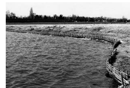
De Driepoel in de jaren zestig

Rd via enkele mooie veldwegen (het gaat wel wat heuvelop en -af!) naar 36 . Terborgh.