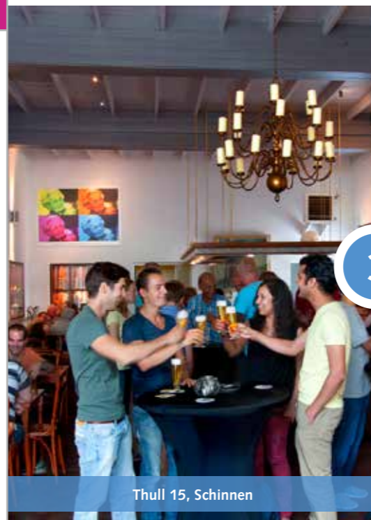
Thull 15, Schinnen