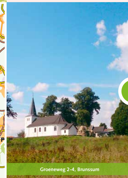
Groeneweg 2-4, Brunssum