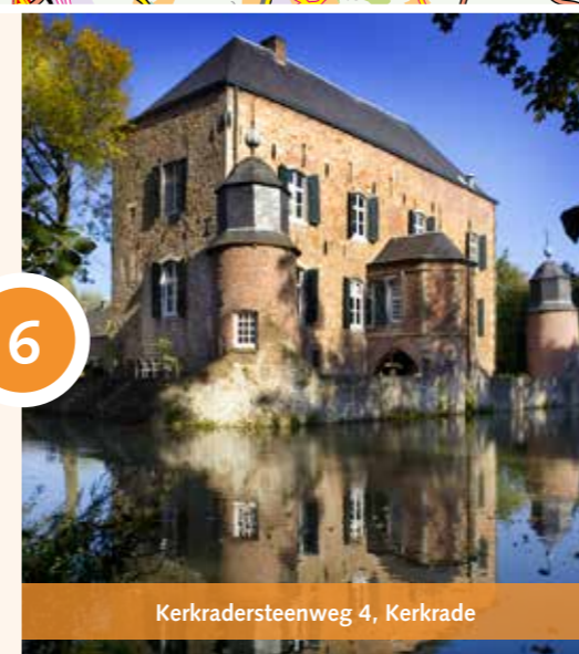
Kerkradersteenweg 4, Kerkrade