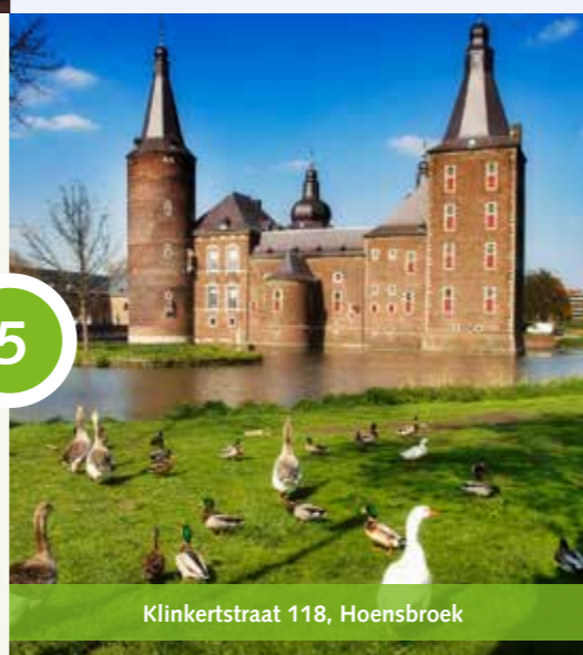
Klinkertstraat 118, Hoensbroek