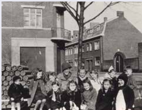
Stralende kinderen poseren in Bleijerheide voor een Amerikaanse munitievoorraad. / Strahlende Kinder posieren in Bleijerheide vor einem amerikanischen Munitionsvorrat.

Vervolg de Rimburgerweg en sla RA de Albert Thijsstraat in. In de bocht naar links ligt achter het blauwe hek van de glashandel (huisnummer 3) een herdenkingsplaquette in de bestrating.