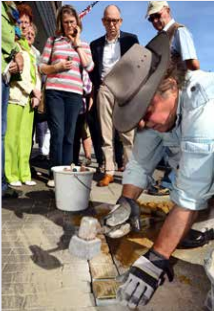
Gunter Demnig legt de Stolpersteine voor de familie Weinblum, Hoofdstraat 34. / Gunter Demnig legt die Stolpersteine für Familie Weinblum, Hoofdstraat 34

daardoor gedwongen wordt er aandacht aan te schenken. Als je met je hoofd naar beneden de tekst leest, toon je daarmee automatisch ook respect. In Kerkrade liggen op vijftien plekken struikelstenen. Sommige zijn geadopteerd door Kerkradse inwoners of verenigingen.