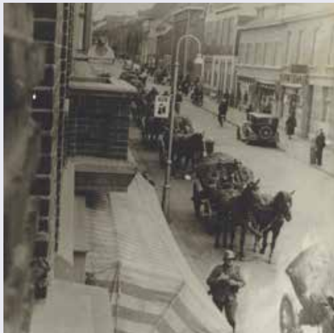
Intocht van Duitse troepen in de Hoofdstraat op 11 mei 1940. / Einzug der deutschen Truppen in der Hoofdstraat am 11. Mai 1940