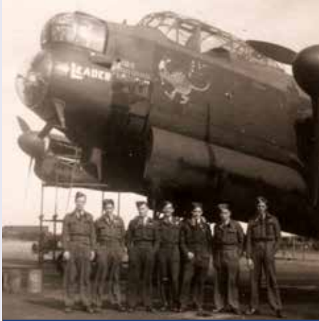
De bemanning voor de Lancaster bommenwerper, die in 1943 neerstortte. 15 / Die Besatzung des Lancaster Bomberflugzeugs, das 1943 abgestürzt ist. 15