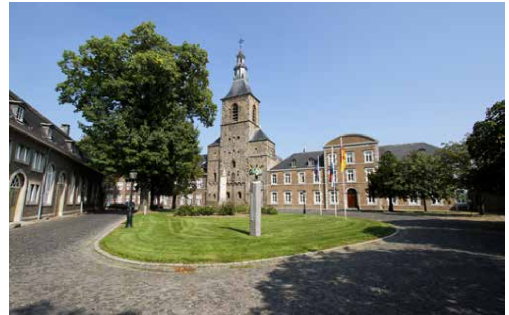
Abdij Rolduc / Abtei Rolduc