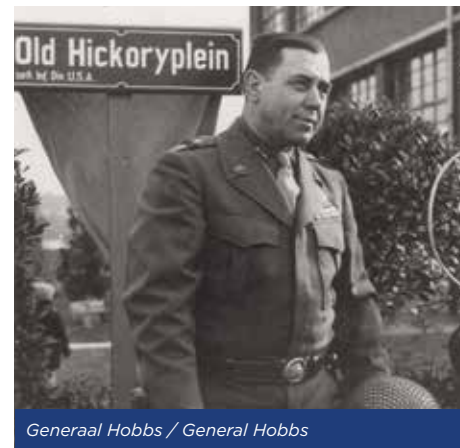
Generaal Hobbs / General Hobbs

Während der Evakuierung 1944 legten die Einwohner von Kerkrade ein Gelöbnis ab, um nach dem Krieg eine Kapelle und ein Denkmal zu errichten, an denen tagtäglich für den Frieden gebetet werden sollte. Dieses Versprechen wurde eingehalten. Dieses