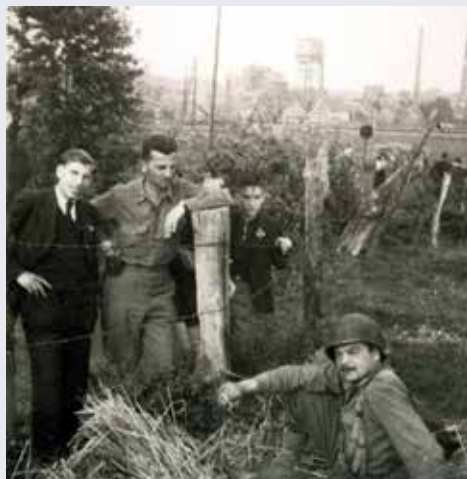
Amerikaanse soldaten in Eygelshoven, met de mijn Laura op de achtergrond. / Amerikanische Soldaten in Eygelshoven, mit der Laura Mine im Hintergrund.

Vervolg de weg en sla RA de Nievelsteenstraat in. Deze volg je tot op het kruispunt waar je LA slaat en de route volgt naar knooppunt 42. Sla bij knooppunt 42 RA naar knooppunt 22 en dan richting knooppunt 20. Na huisnummer 5 aan de Grensstraat sla je RA de Kloosterlindeweg in (steil!). Je komt terug bij het startpunt, Abdij Rolduc.