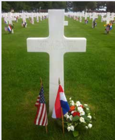
Oorlogsgraf Margraten / Kriegsgrab Margraten

In 2019 bestaat de Oranjevereniging Kerkrade 100 jaar. De vereniging organiseert onder meer herdenkingen met betrekking tot de Tweede Wereldoorlog en de bevrijding van Kerkrade. Ook zijn er jaarlijks projecten voor de schooljeugd van Kerkrade en de Duitse buurgemeente Herzogenrath, met als thema 'Vrede-vrijheid-verdraagzaamheid - Kerkrade grenzeloos'. Een van deze projecten is de adoptie van een graf van een Amerikaanse soldaat in Margraten. De Oranjevereniging onderhoudt eveneens nauwe banden met de '30th Infantry Division Old Hickory', de bevrijders van Kerkrade. Voor meer info: www.oranjeverenigingkerkrade.nl