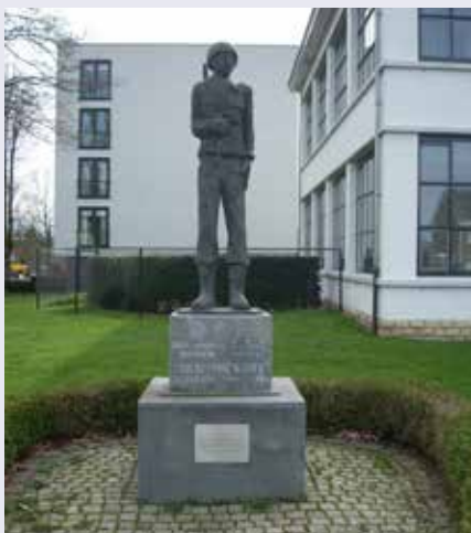
Monument voor de bevrijders van Kerkrade 7 Denkmal für die Befreier von Kerkrade 7

Sla na de schacht LA en meteen RA het geasfalteerde pad in tussen de bomen door.