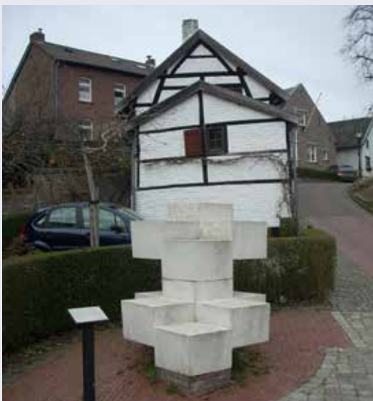
Oorlogsgedenkteken Eygelshoven 17 Ehrenmal Eygelshoven 17

Vervolg de weg RD en ga met de bocht mee LA de St. Antoniusstraat in. Neem vervolgens de Voorterstraat, die je alsmaar