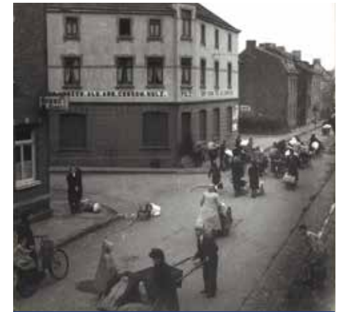
Bij de evacuatie in september 1944 lopen bewoners uit Bleijerheide langs Consum Holz / Bei der Evakuierung im September 1944 laufen Bewohner aus Bleijerheide am Consum Holz vorbei

Diese Plakette erinnert an die Evakuierung