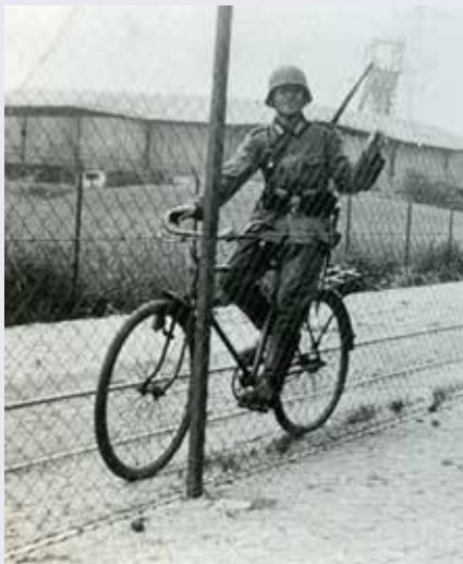
Een Duitse soldaat poseert aan de Nieuwstraat met op de achtergrond de wielierbaan en de Domaniale Mijn. / Ein deutscher Soldat posiert an der Nieuwstraat mit der Wälerbaan und der Domaniale Mine im Hintergrund

Neem ook even een kijkje bij de fotoborden op drie locaties aan de Nieuwstraat. Zij brengen opmerkelijke momenten uit de historie van de straat tot leven. De fotograaf stond destijds op de plaats waar nu het bord staat.