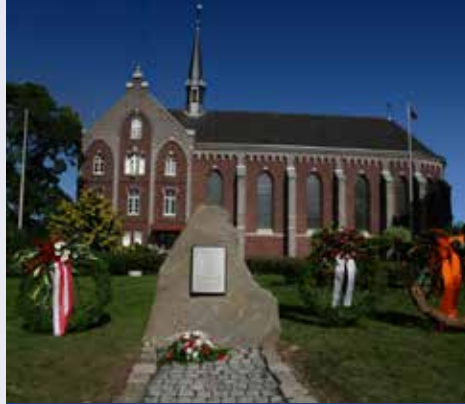
Herdenkingssteen Lancaster bommenwerper 15 Gedenkstein Lancaster Bomber 15

Fiets RD. Op de volgende rotonde staat 'D'r Knub'.